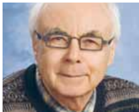
par Jean-Paul Simard Écrivain